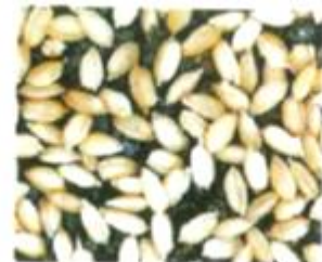
(参考)170g播種 (催芽籾で約210g)