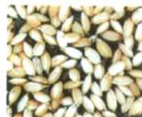
(参考)200g播種 (催芽籾で約250g)