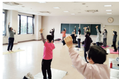
腕を曲げ伸ばす参加者

JAさんとう営農センターは1月21日、こしじ支店で「みのるくん健康教室」を開きました。地域から15人が参加。講師の指導のもと、身体の隅々までストレッチしました。