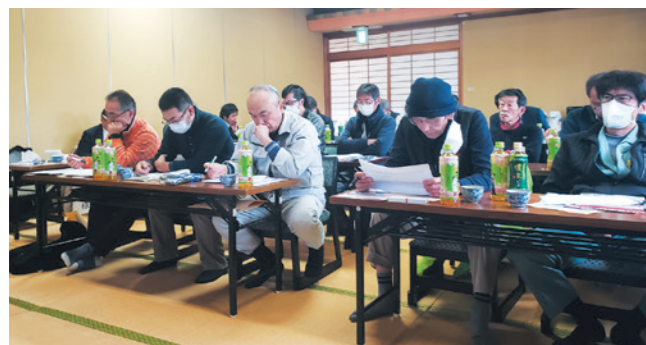
講義に集中する参加者ら

さんとう地区では直は栽培の拡大を進めており、新規に取り組む担い手を対象に直は機を無償で貸し出すなど支援しています。