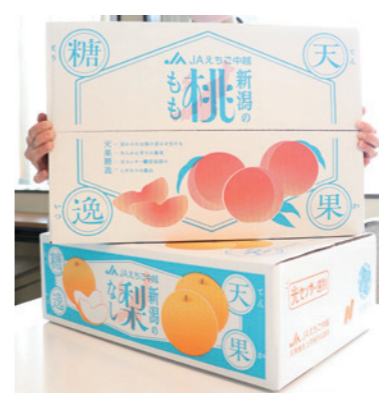
受賞した日本梨と桃の出荷箱(ぜひ出荷時期にスーパーなどで探してみてください!!)

果実の出荷部会「JA天果糖逸出荷販売協議会」の日本梨と桃の出荷箱が「日本パッケージデザイン大賞2025」で銀賞を受賞しました。毎年1,000点以上の作品が集まり、デザイン性や創造性を競うコンペティションです。