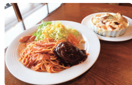
コンビプレートのマム(税込1,243円)

住 加茂市寿町7-45 Tel 0256-52-9992 営 10:00~19:00 休 木曜日