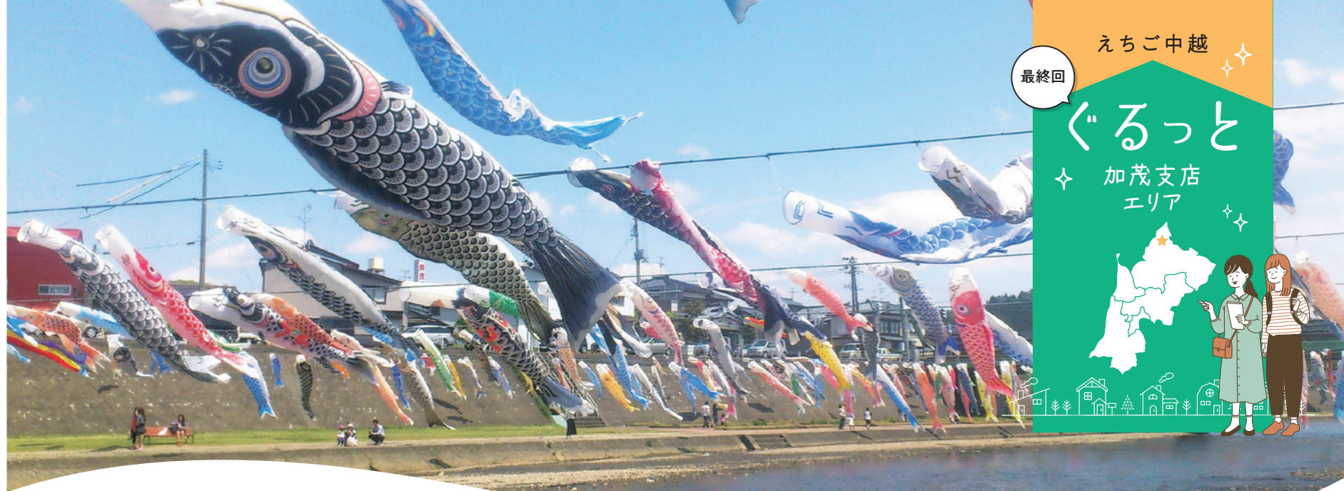
「加茂川を泳ぐ鯉のぼり」(葵橋周辺) 毎年4月上旬~5月上旬