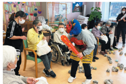
鬼に豆を投げる利用者

JA中通デイサービスセンターは2月の節分に合わせ、「自分の中の鬼退治 節分会」を開き、施設利用者と厄払いを行いました。