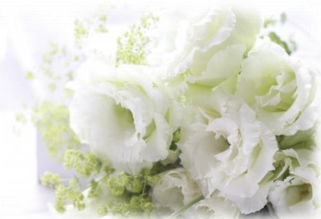
1/23 フラワーアレンジメント教室 真っ白なお花で