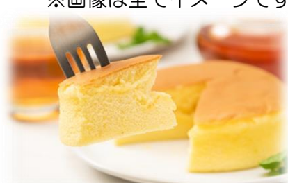
1/22 お菓子教室 台湾カステラ