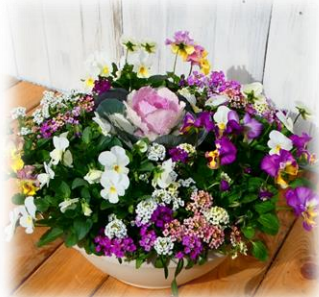
1/17 寄せ植え教室 季節の花の寄せ植え