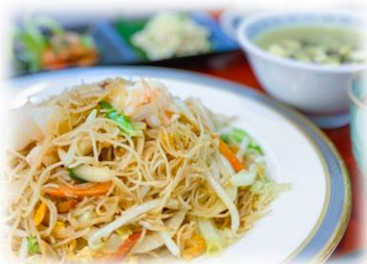
1/15 中華料理教室 五目焼きビーフン・ニラ餃子