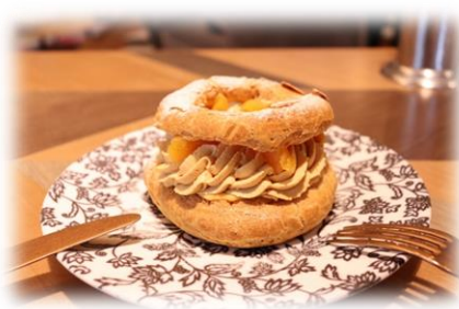
12/18 お菓子教室 パリプレスト