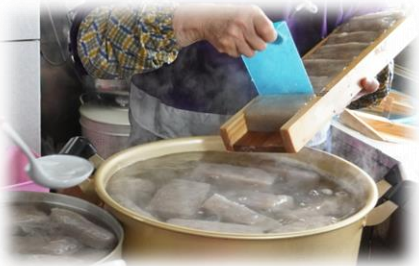
12/3 郷土料理教室 イモから作る手作りこんにゃく