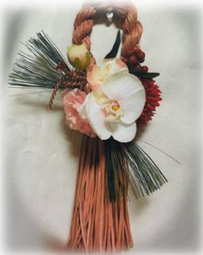
12/6 プリザーブドフラワー教室