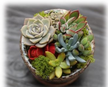
12/24 フラワーショップ花ママ主催 カラーサンド寄植教室