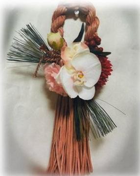
12/6 プリザーブドフラワー教室