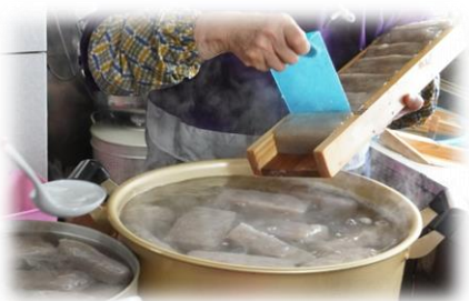
12/3 郷土料理教室 イモから作る手作りこんにゃく