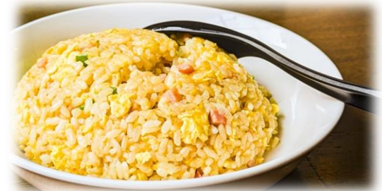
12/12 本格四川料理教室 炊飯器で作るチャーハン 他