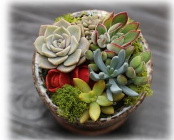
12/24 フラワーショップ花ママ主催 カラーサンド寄植教室