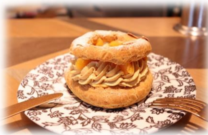
12/18 お菓子教室 パリプレスト