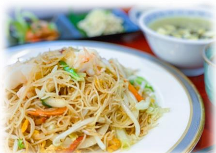
12/17 中華料理教室 五目焼きビーフン 他