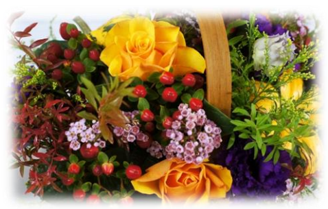
10/24 フラワーアレンジメント教室 ハロウィンのアレンジメント