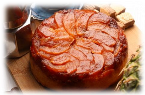
10/30 お菓子教室 リンゴのアップサイドダウンケーキ