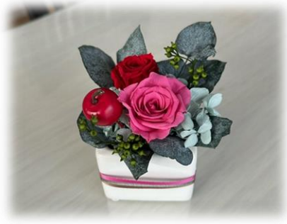
10/4 プリザーブドフラワー教室 実りの秋