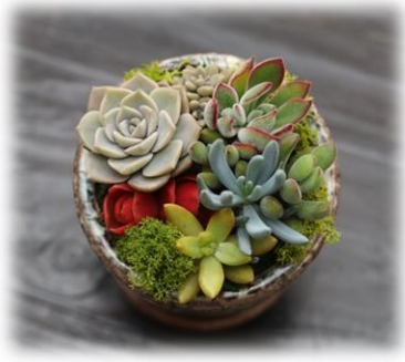
10/29 フラワーショップ花ママ主催 カラーサンド寄植教室