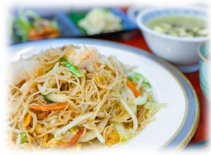
10/9 中華料理教室 五目焼きビーフン 他