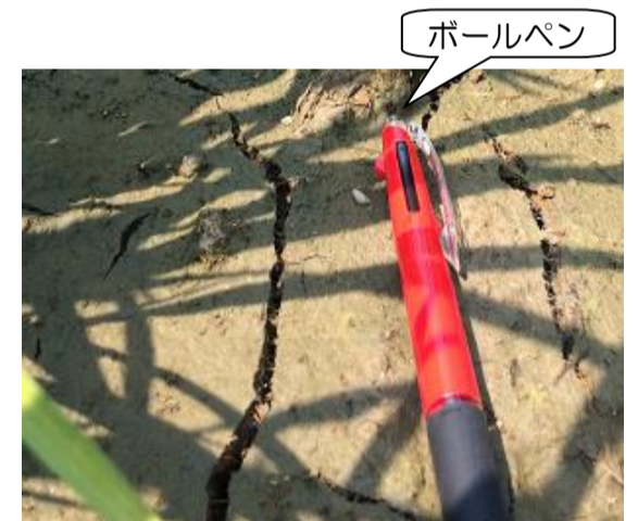
【小ヒビのイメージ図】