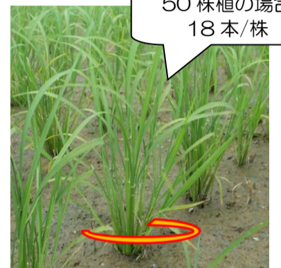
〈コシヒカリの中干し目安の茎数〉